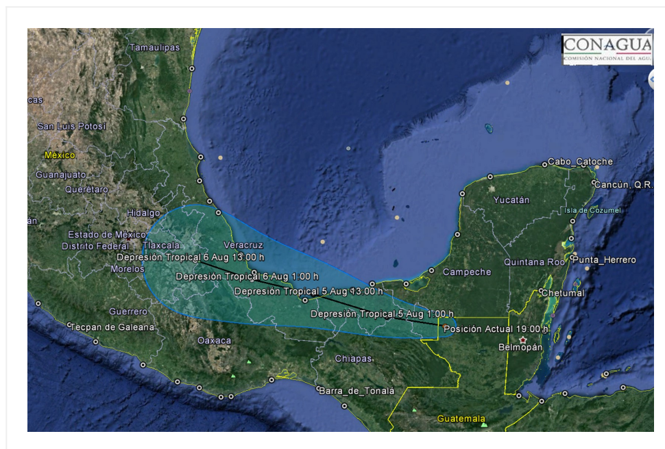
Trayectoria pronóstico de la Tormenta Topical "Earl"